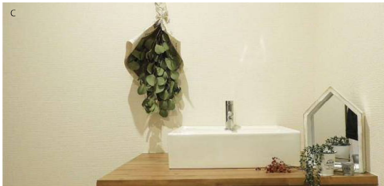
A. 赤いキッチンがリビングの雰囲気を明るくしてくれます。リビングのカウンターでは奥様のちょっとした作業や、お子様のスタディスペースとしても良いですね。 B. 和室にはリビングと廊下からアクセスでき、来客時には個室としても使用できます。 C. 2階の洗面は植物を飾ったり、自分の空間を楽しめるおしゃれスペースに出来ます。